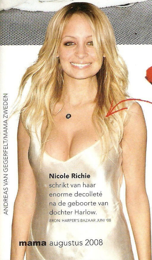
Nicole Richie schrikt van haar enorme decolleté na de geboorte van dochter Harlow. BRON: HARPER'S BAZAAR JUNI '08

"Uh-oh, hiervoor kan ik opgepakt worden"