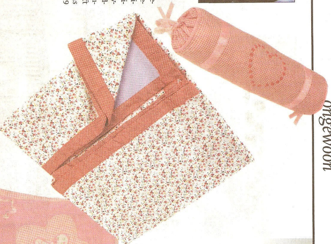
Zoete spullen van Babiesandbutterflies.